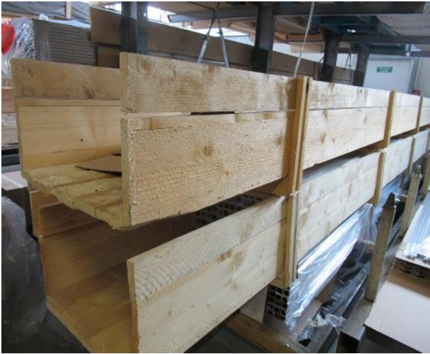
i.O. → Stabile Kiste Stapelbar