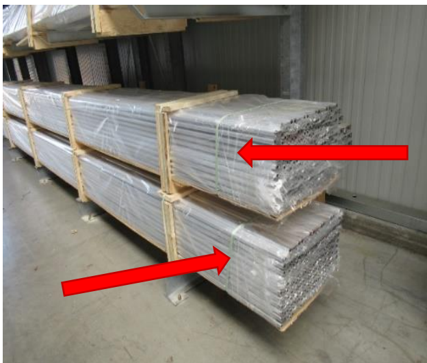
n.i.O → Seiten und Enden nicht geschützt