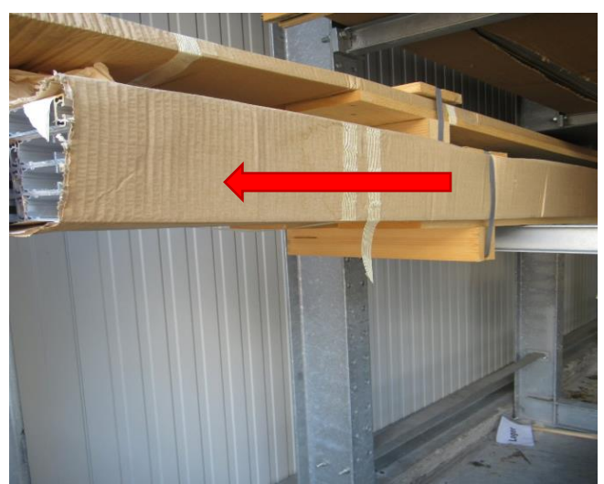
n.i.O → Seiten NUR mit Karton geschützt.