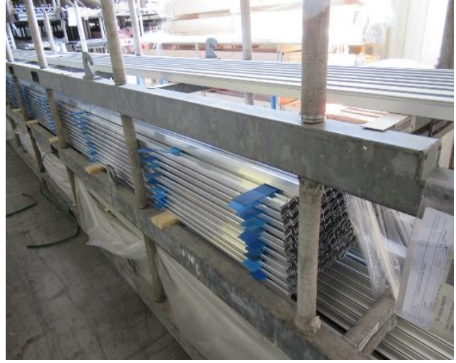
i.O. → Stahlgestelle